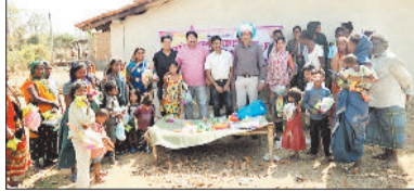
बच्चों व ग्रामीणों के साथ उपस्थित क्लब के सदस्य।

क्लब सदस्यों ने पचभैया पारा व भारत भवन पहुंचकर गरीब एवं जरूरतमंद बच्चों को होली की सामग्री, गुलाब, पिचकारी, टोपी, रंग, बाजा तथा मिठाई का वितरण किया। बच्चों के चेहरों पर रंगों के