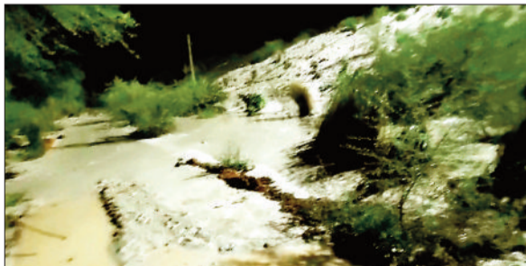
तटबंध टूटने से बहता राखड़।

झाबू-लोलतोला के पास राखड़ बांध का निर्माण किया गया है। जिसका तटबंध एक बार फिर क्षतिग्रस्त हो गया है। तटबंध के क्षतिग्रस्त होने से राखड़ मिश्रित पानी हसदेव नदी सहित आसपास के क्षेत्र को प्रदूषित कर रहा है। इस बांध में संयंत्र से पानी मिश्रित राख भेजी जाती है। बांध काफी पुराना होने की वजह से भर चुका है, इससे निपटने के लिए प्रबंधन द्वारा कई बार बांध की ऊंचाई भी बढ़ाई जा चुकी है। उल्लेखनीय है कि राखड़ बांध भर जाने की वजह से दबाव पड़ने पर