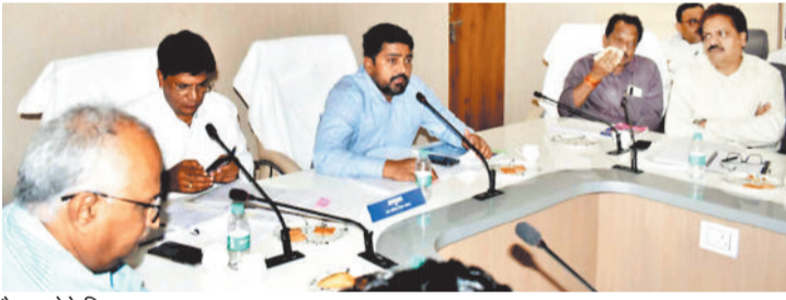
बैठक लेते निगम आयुक्त।