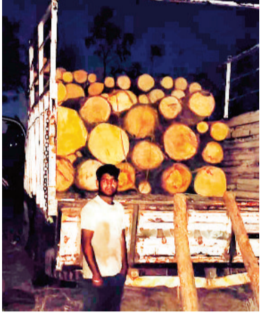
जप्त लकड़ी से भरा पिकअप।