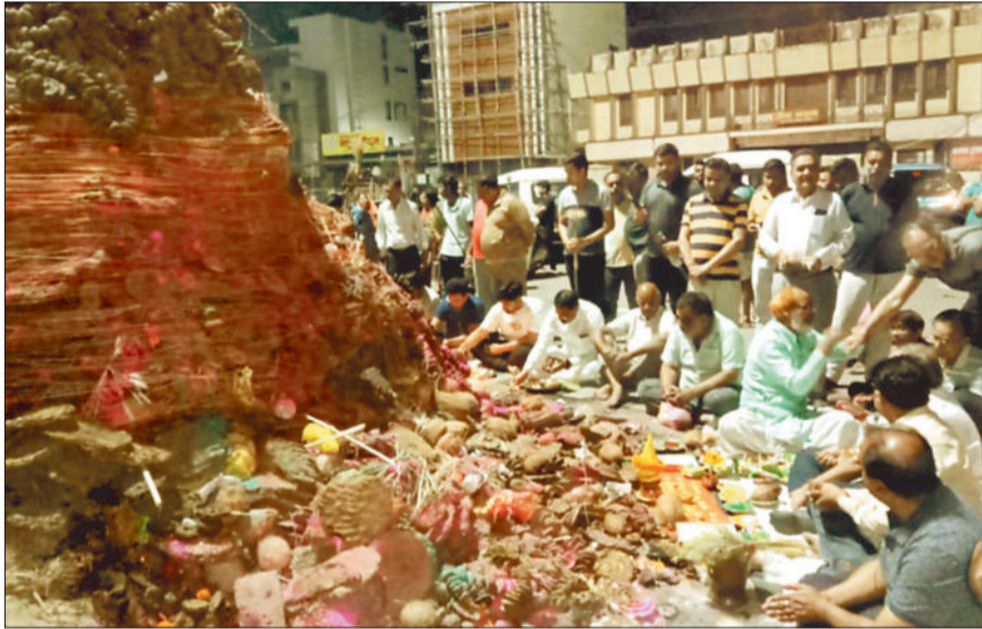
पुराने बस स्टैंड में होलिका पूजन करते अग्रवाल समाज के सदस्य।

रंगों के त्यौहार की धूम शहर समेत उपनगरों में एक सप्ताह पूर्व से ही दिखने लगी। बाजार में जहां देखो, वहां रंग व गुलाल की दुकानें सजी हुई हैं। त्यौहार की